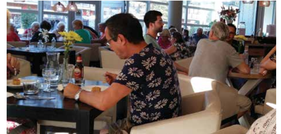
Gezellige maaltijd in Da Vinci.

Ook 'Wijkdorp Meerwijk' is op stoom. Zoals u wellicht nog weet zijn we een jaar geleden begonnen met 'Wijkdorp 3.0'. Dit is inmiddels omgedoopt in 'Wijkdorp Meerwijk'. In de wijkraadsvergadering van september worden we bijgepraat over de laatste stand van zaken. Concrete resultaten zijn er al: de activiteiten in Da Vinci en de Zoefzoef die door de wijk tuft. Tegen een geringe vergoeding brengt deze mensen die minder mobiel zijn naar bestemmingen in Schalkwijk. Ook naar Da Vinci, als u er wilt eten maar er zelf niet kunt komen.