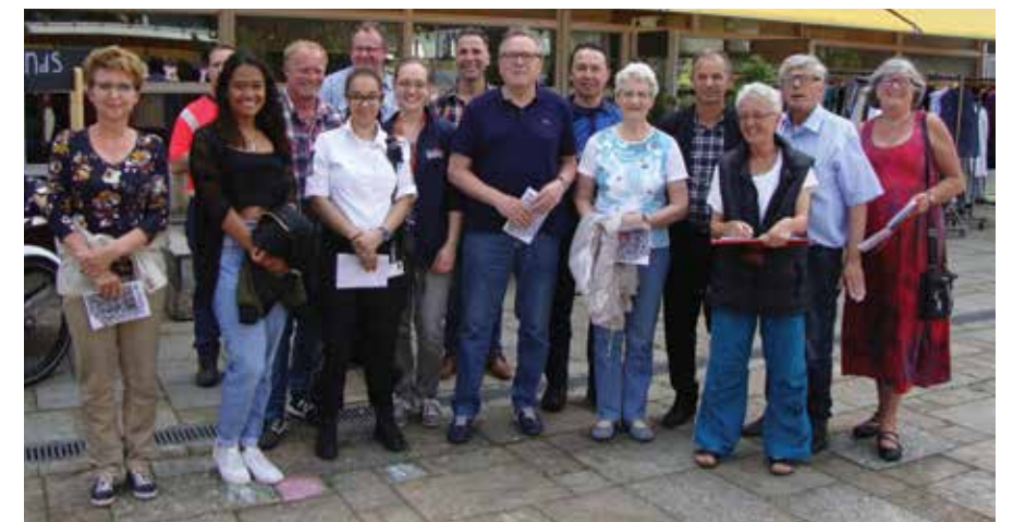
Deelnemers aan een eerdere wijkshow

Op 19 september is er weer een wijkshow. Bewoners en professionals gaan samen de wijk in om te kijken waar de knelpunten zijn. Tijdens de wandeling kunt u gemeente, corporaties en handhaving persoonlijk vertellen waarover u letterlijk of figuurlijk struikelt. Aanmelden hoeft niet, u kunt zich gewoon aansluiten. We verzamelen om 9.00 uur op het Leonardo da Vinciplein. Loopt u mee?