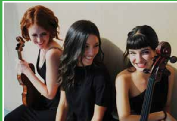
Artem Trio 15 september in winkelcentrum.

Let op: Op 24 november komt Sinterklaas in het winkelcentrum. Het reguliere concert van de laatste zaterdag is in november daarom verplaatst naar de 17e.