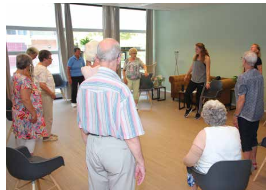
Bewegen op muziek.