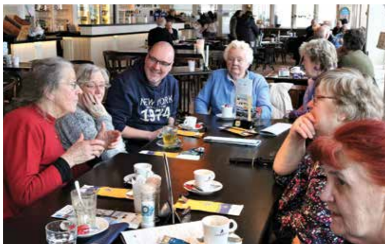
Uitstapje naar Zandvoort.

Voor meer informatie kunt u bellen met 023 205 23 19, of mailen naar info@haarlem-sjonger.nl . Op de website www.haarlem-sjonger.nl vindt u alle informatie, ook het programma. Facebook: Haarlem Sjonger. Het programma wordt overigens ook per post opgestuurd, dus geen probleem voor mensen zonder internet.