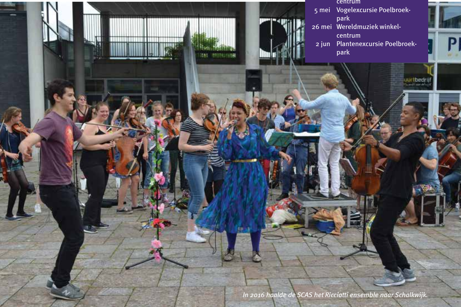
In 2016 haalde de SCAS het Ricciotti ensemble naar Schalkwijk.