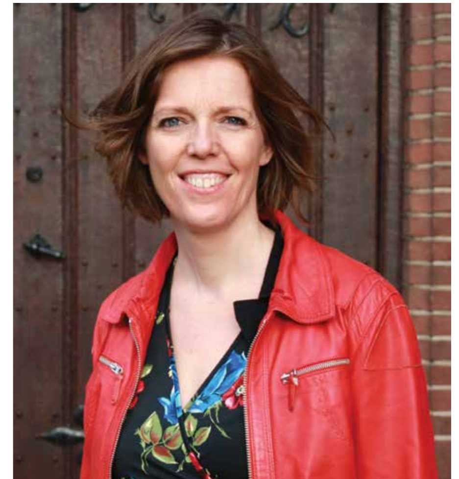
Wethouder Cora-Yfke Sikkema spreekt op de jaarvergadering.