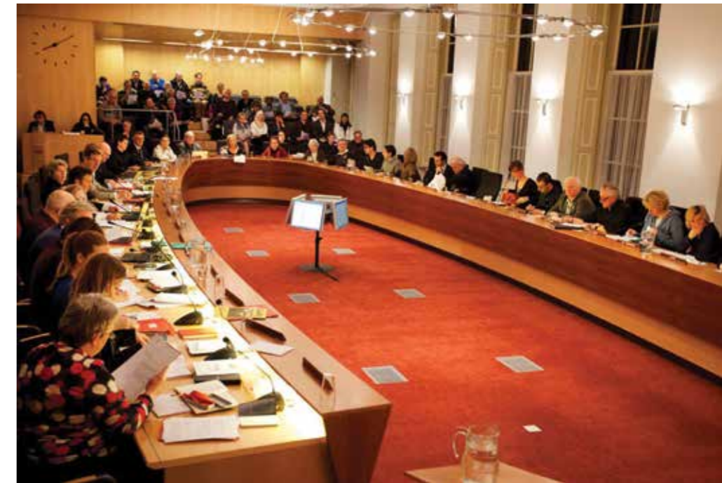
Vergadering van de Haarlemse gemeenteraad.