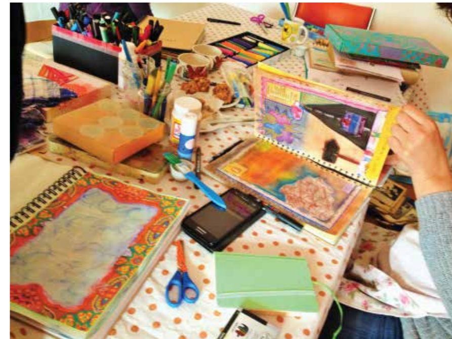
Cursus Art Journaling.

jaar geef ik les. Meestal is dat in mijn atelier in de Hagestraat, maar het kan ook bij mensen thuis. Mijn kunstzinnige kant en het schrijven komen samen in de cursus Art Journaling. Op een creatieve