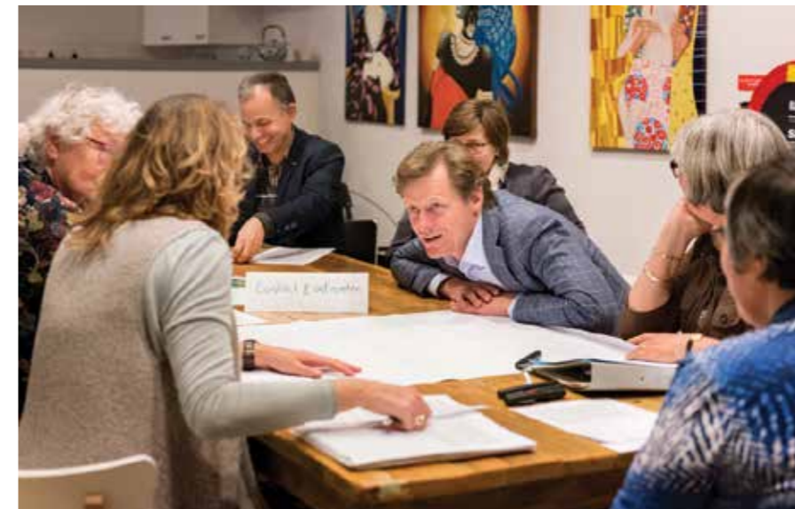
In kleine groepjes werd enthousiast verder nagedacht.