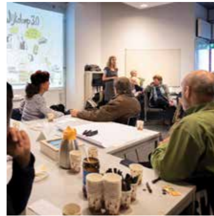
Presentatie resultaten interviews.

Een goed netwerk is belangrijk voor een fijne oude dag. Veel mensen realiseren zich niet hoe moeilijk het kan worden om zelfredzaam te blijven als een partner wegvalt of ziek wordt. Vaak is er geen of nauwelijks contact met de burens. Soms komt dat door taalproblemen, maar sowieso blijkt de drempel om hulp te vragen hoog. Maar wie haalt er boodschappen voor je, wie houdt in de gaten of je nog buiten komt, hoe kom je aan informatie over leuke activiteiten als je geen computer hebt, wie brengt je naar een dokter of ziekenhuis?