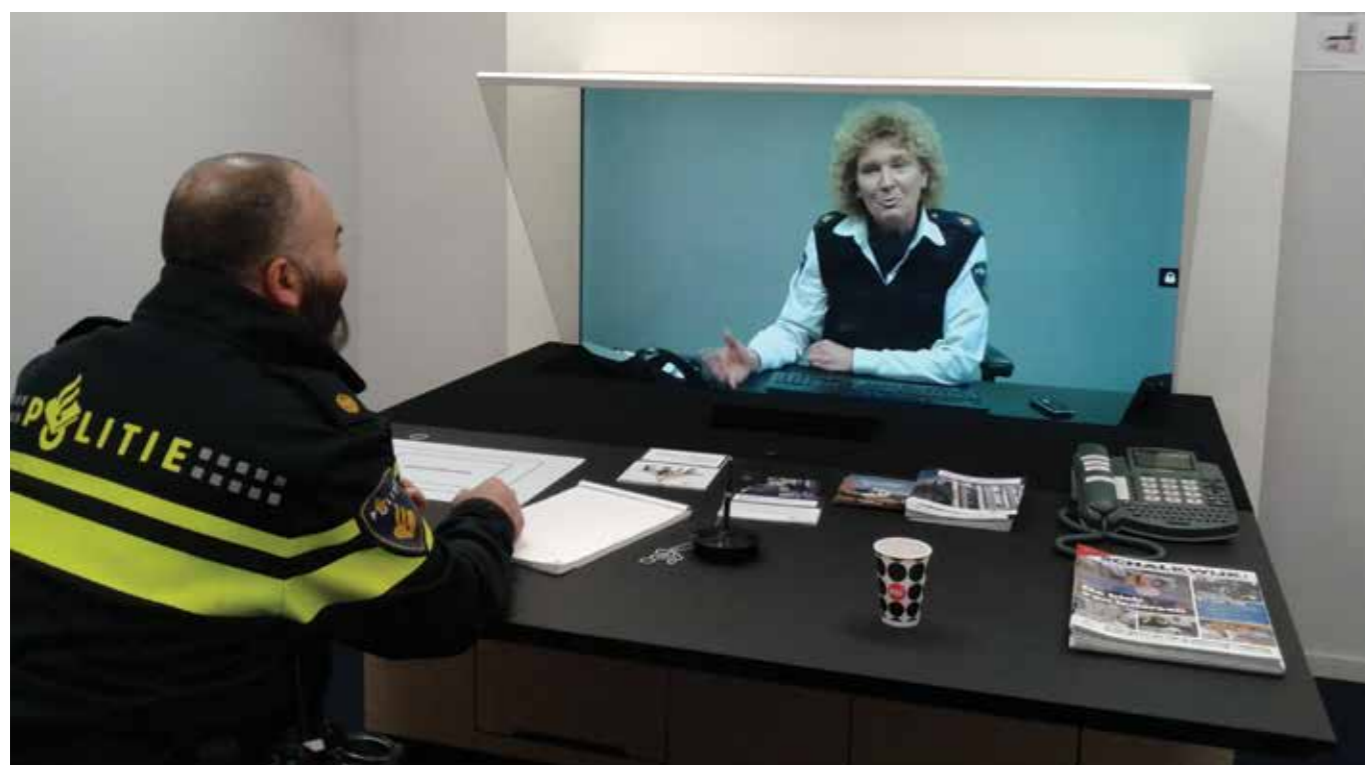
Via videoverbinding een zogenoemde 3D-aangifte doen.