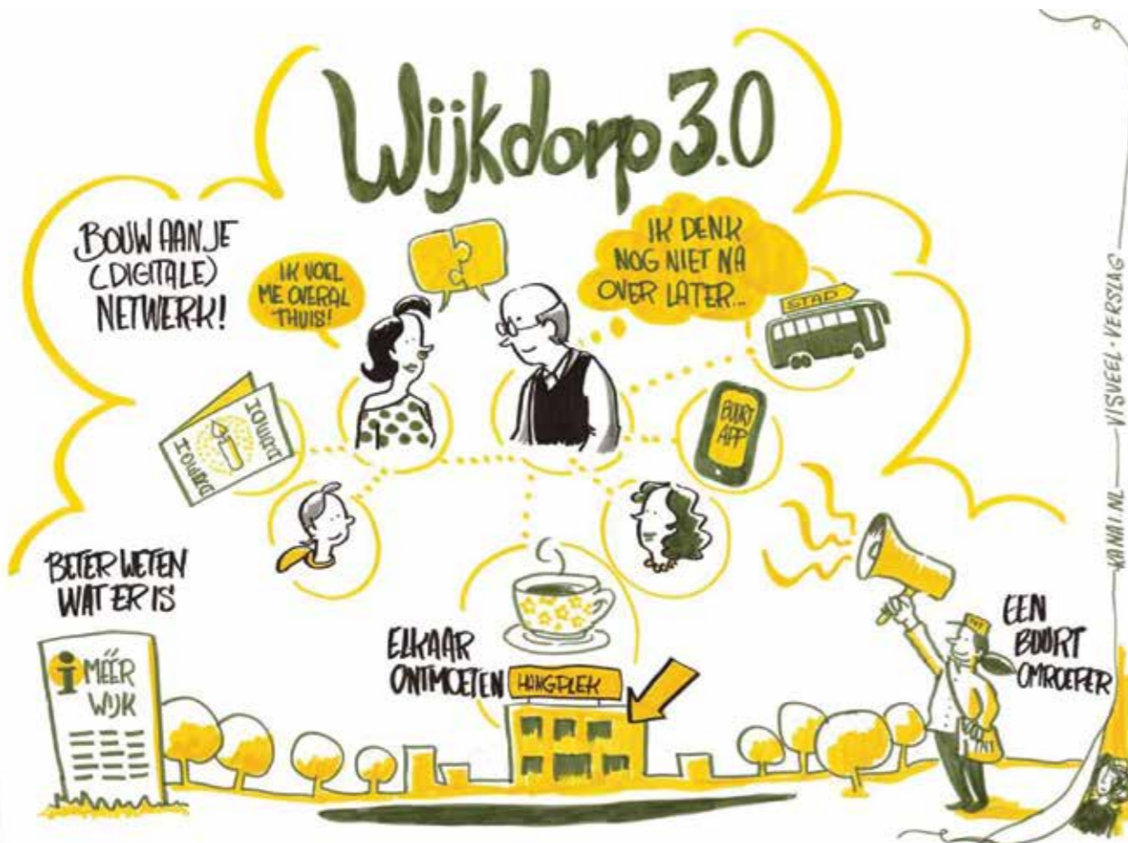
Getekende samenvatting interviews. Tekening Anabella Meijer.

Natuurlijk is er thuiszorg en zijn er vrijwilligers die dit soort hand- en spandiensten verlenen, maar weet je die te vinden? Vereenzaam je niet als vele dierbaren om je heen wegvallen? Is er een plek in de wijk waar je een kop koffie kunt drinken en samen eten, waar je kunt ontspannen bij een biljartpartijtje of gymles?